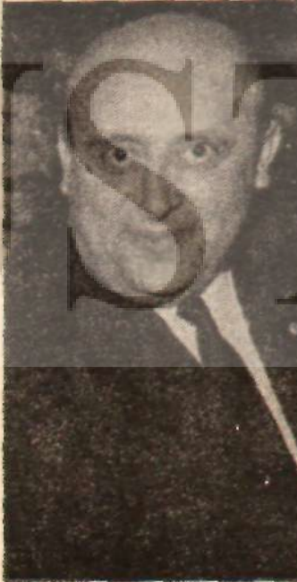
Süleyman Demirel Araba yokuşa sardı

Başkaldırmanın sonucu ne olacaktır? AP'nin milyonları savunuca başı ve gövdesi arasında tam bir terslik vardır. Bu terslik yavaş yavaş rahatsızlık yaratmaktadır. Ayrıca Bilgiç'in kenara itilmesi ve masonluk, Amerikancılık söylentileri, AP kütlesinin kulaklarına kar suyu kaçırmıştır. Rahatsızlık genişleyecek midir? Yok-