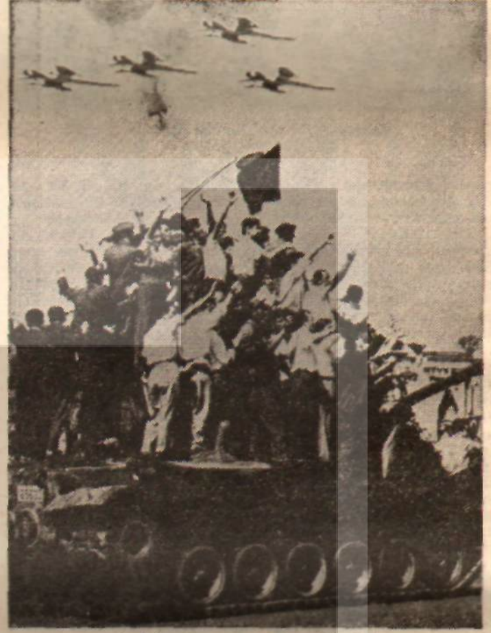
27 Mayıs'tan sonra sevinç gösterileri O günleri unutanlar var!

doğurdu. MP Grubu, Apaydın'ın gensoru önergesine beyaz oyu vereceğini açıklayarak ortaklarını güç duruma bırakmaya niyetli bulunduğunu belirtti. CHP ise, hükümetin ilk fırsatta devirmeye niyetli intibahı vermektedir. CHP, adam kazanmak, ya da MP dışındaki partilerden birini koalisyondaya sırtmak çabası içindedir. Bu ortamda AP içinde 10-15 kişilik bir muhalefet dahi önemli sonuçlar doğurabilecektir. Yalnız unutmamak gerekir ki, bir hükümet buhranı, AP liderlerinin bir daha altından kalkamayacakları büyük bir fiyaskodur. AP yöneticileri böyle bir fiyaskoyu önlemek için her türlü tåvizi vermeye hazırdırlar.