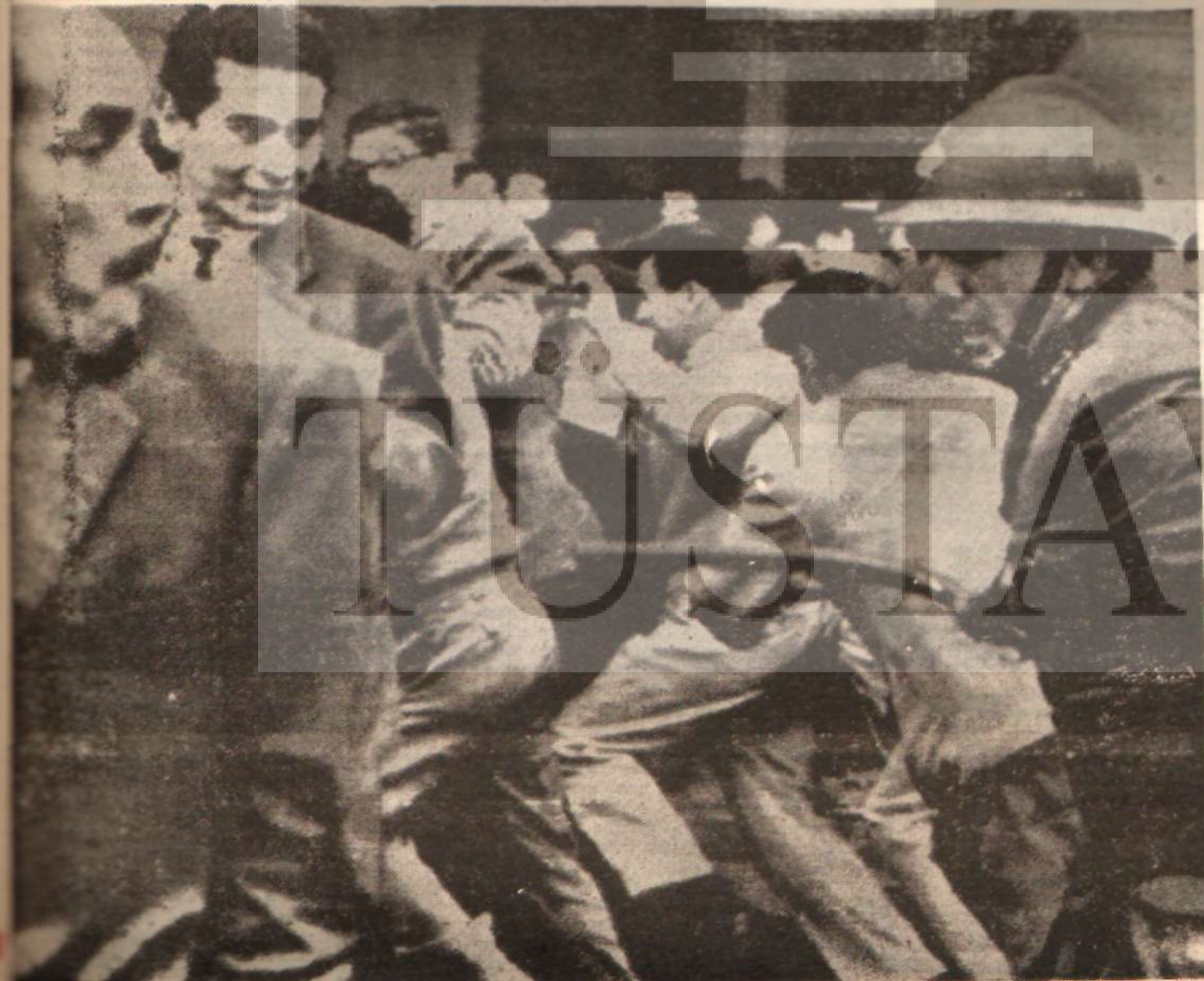
PERUDA BİR HALK HAREKETİ BASTIRILYOR: Gücünü emperyalizmden alan zorbalık

Birleşmiş Milletlerin Cenevre Ticaret Konferansında az gelişmiş ülkelerin «eşit olmayan» mübadeleler yoluyla sömürülmesini az çok önlemek amacıyla bu ülkelerin ileri sürdükleri dünya ticaretini