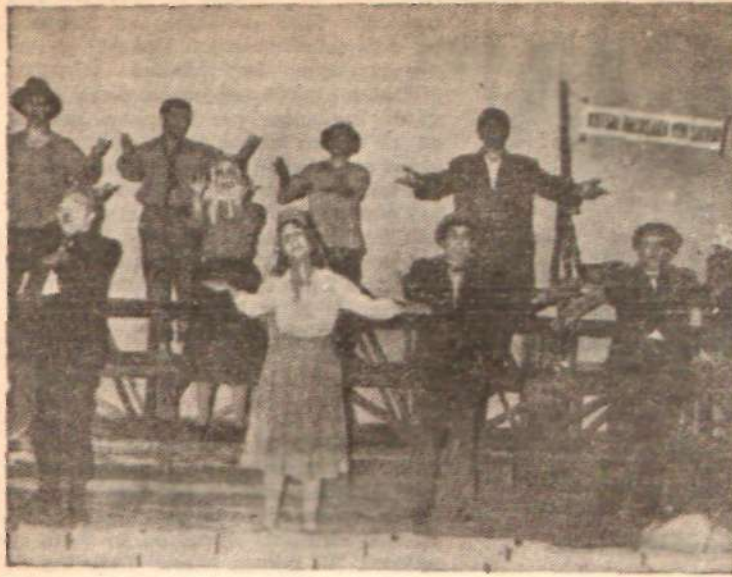
AYAK - BACAK FABRİKASI: Grev sahnesi.